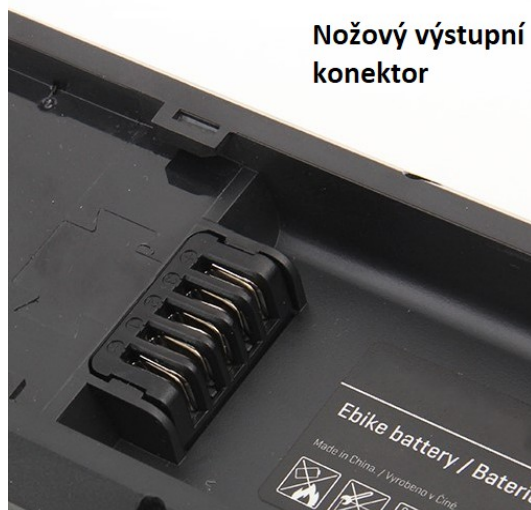
Nožový výstupní konektor